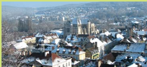
L'hiver a fait son entrée avec quelques semaines d'avance. La neige s'est invitée et a recouvert notre Ville de son blanc manteau !